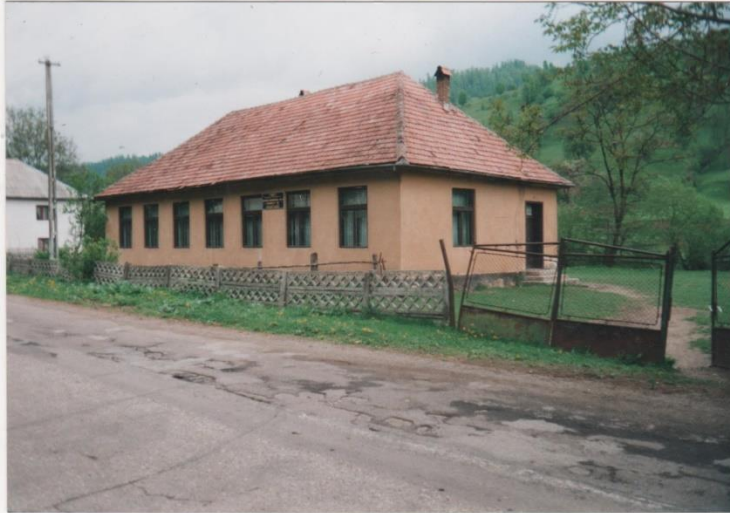
ȘCOALA PRIMARĂ - VALEA LUNGĂ